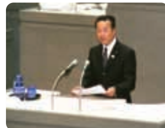
▲都議会本会議で一般質問に立つ。都政改革へ真剣勝負