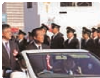
▲都議会警察・消防委員長としてパレードに参加