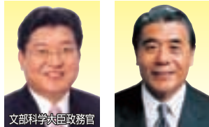
文部科学大臣政務官