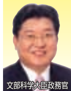
文部科学大臣政務官 衆議院議員 萩生田光一