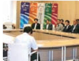
▲都議会自民党幹事長代行に就任。関係各方面に挨拶