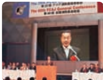
▲アジア消防長協会、全国消防長会の合同総会にて挨拶