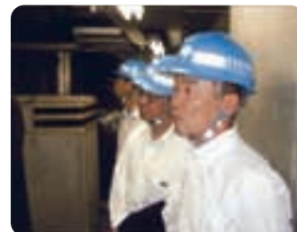
▲都水道施設の隅々まで自分の目で確認。とにかく現場主義