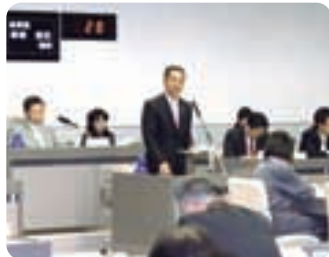
▲平成21年予算特別委員会で自民党を代表し総括質疑に立つ